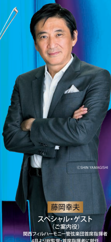
藤岡幸夫 スペシャル・ゲスト (ご案内役) 関西フィルハーモニー管弦楽団首席指揮者 4月より総監督・首席指揮者に就任 東京シティ・フィル首席客演指揮者 BSテレ東「エンター・ザ・ミュージック」 (毎週土曜日朝8:30)司会者