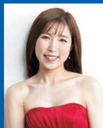
南 さゆり (ソプラノ)